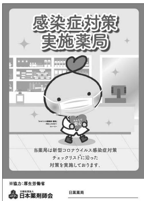
みんなで安心マーク

日本薬剤師会が作成する同マークについては、「薬局内における新型コロナウイルス感染症対策チェックシート【第二版】」及び「薬局内における新型コロナウイルス感染症対策チェックリスト」（項目は別紙2を参照）の全ての項目を実践していることを自己確認の上、同マークとともに「薬局内における新型コロナウイルス感染症対策チェックリスト」を掲出することで使用が可能となっている。